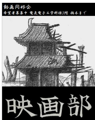
動画同好会ポスター