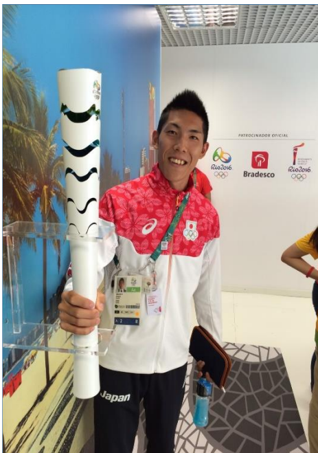
本校陸上競技部OB 衛藤 昂 2016リオデジャネイロオリンピック 日本代表 走高跳で出場