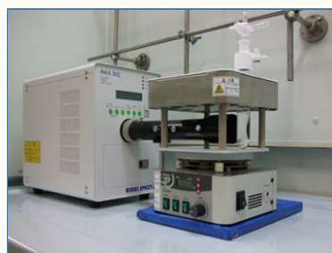
光化学反応の合成装置