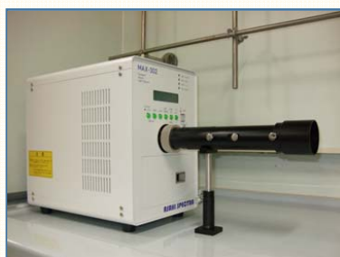
光照射装置 (キセノン光源)

message 身の回りの工業製品をつくるためにいろいろな化学反応が活用されています。「持続可能な社会」を構築するために貢献したいと思います。