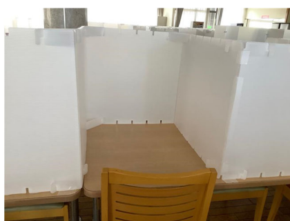
飛沫防止用の仕切り