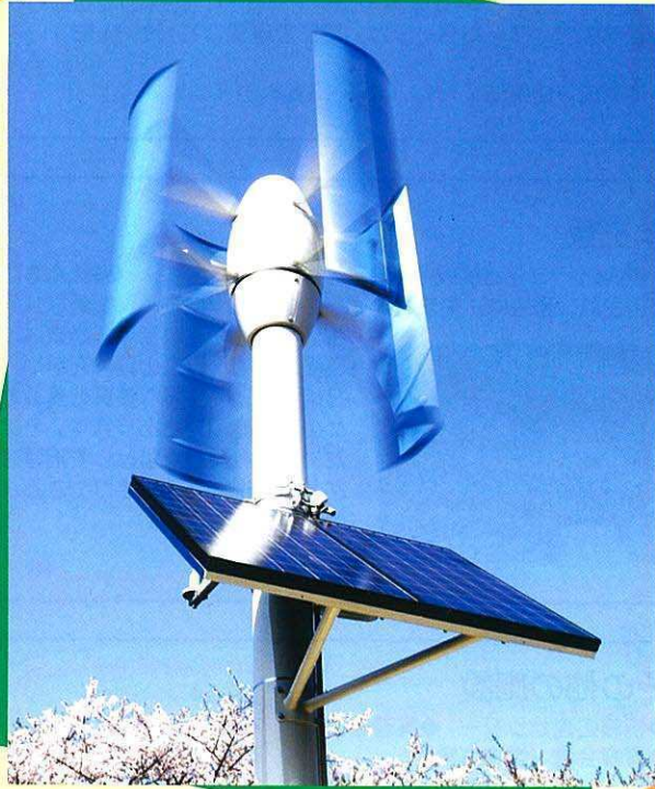
風力発電機 (文部科学省「質の高い大学教育推進プログラム」に採択)