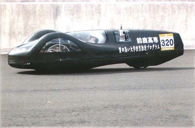
エコカー (文部科学省「質の高い大学教育推進プログラム」の一環として製作)