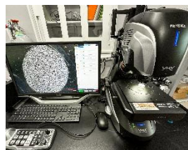
マイクロスコープ