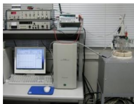
電気化学測定装置