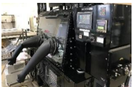
グローブボックス(京大)