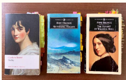
ブロンテ三姉妹の小説(左からシャーロット『シャーリー』、エミリー『嵐が丘』、アン『ワイルドフェルホルの住人』)

研究テーマ ブランウェル初期作品における英国植民地主義や戦争の表象について 所属学会 日本英文学会、日本ブロンテ協会、関西学院大学英米文学会、神戸英米学会 researchmap https://researchmap.jp/2004_2007 連絡先 furuno@genl.suzuka-ct.ac.jp