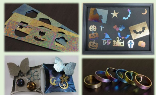
学生が作成した作品の一例

Message 学生の皆様、質問や相談等がありましたら、気軽に研究室へ立ち寄ってください。