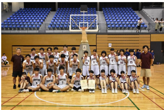
バスケットボール部 全国高専体育大会 男子・女子ともに準優勝 (令和元年度 松江)