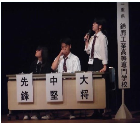
鈴鹿高専文芸部チームの活躍 (平成27年度 盛岡短歌甲子園)