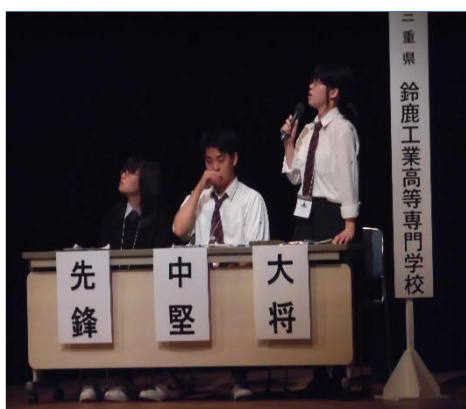
鈴鹿高専文芸部チームの活躍 (平成27年度 盛岡短歌甲子園)