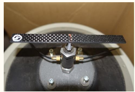
CFRPの中央加振試験の様子