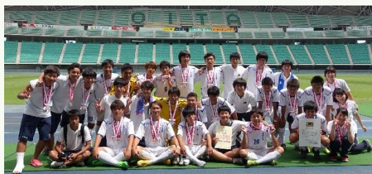
(H27全国高専大会準優勝・大分銀行ドーム)

Message 本校の学生の質問・補習の相談も歓迎します。普段の勉強はもちろん, 進学 の準備にも気軽に機械工学科棟2階の第9教員室まで来てください。