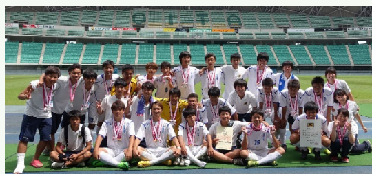
(H27全国高専大会準優勝・大分銀行ドーム)

Message 本校の学生の質問・補習の相談も歓迎します。普段の勉強はもちろん, 進学への準備にも気軽に機械工学科棟2階の第9教員室まで来てください。