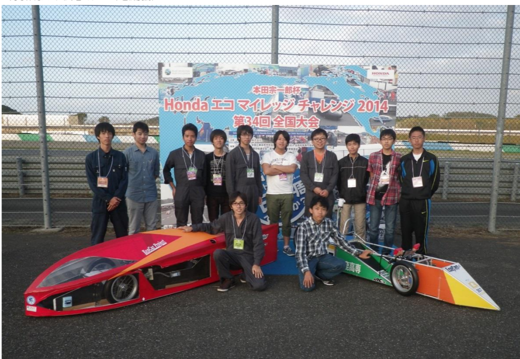
Hondaエコマイレージチャレンジ2014 (予選7位、決勝13位)