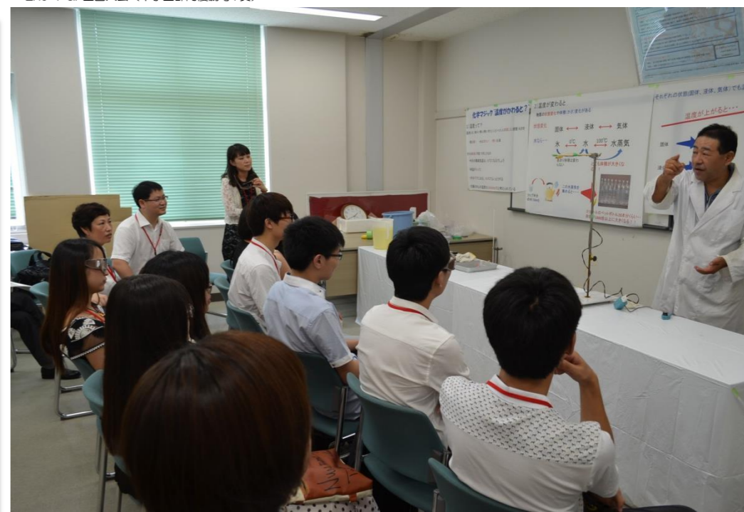
常州情報職業技術学院来校 (化学実験)