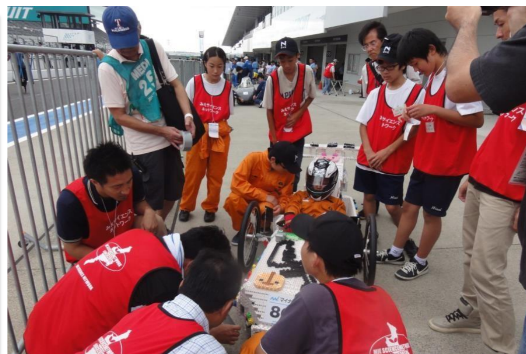
Ene-1 GP全国大会 (中学生部門優勝等7賞)