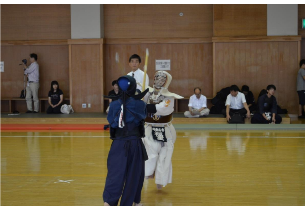
高専体育大会 (剣道女子 13年連続優勝)