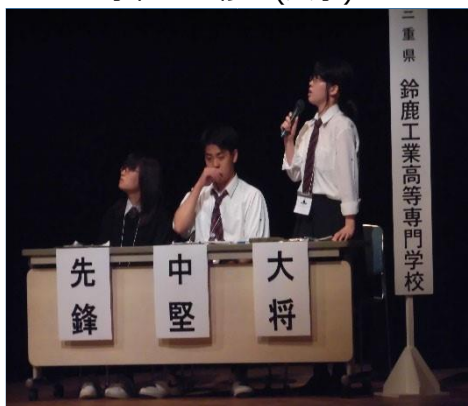
鈴鹿高専文芸部チームの活躍 (平成 27 年度盛岡短歌甲子園)